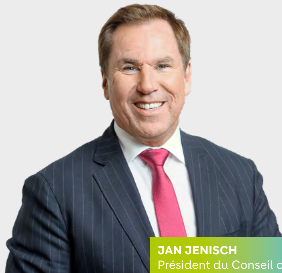
JAN JENISCH Président du Conseil d'administration et Directeur général